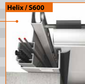
Helix / S600

Dla maksymalnego bezpieczeństwa zawiasy boczne są niemal płaskie co zapewnia doskonałe spasowanie z pionowymi uszczelkami bocznymi.