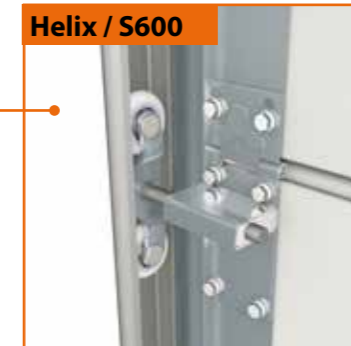
Helix / S600

Brama spiralna Helix zwinia się w kierunku wewnętrznej fasady budynku i wymaga przestrzeni 1100mmx1200 mm ponad bramą oraz 350 mm po stronie napędu i 120 mm po stronie bez napędu.