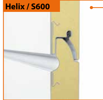
Helix / S600