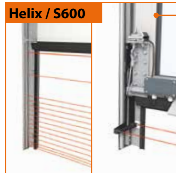
Helix / S600

Połączenie pomiędzy segmentami ISO i ALU jest wiatroodporne i wodoszczelne ( 3 klasa parcia wiatru)